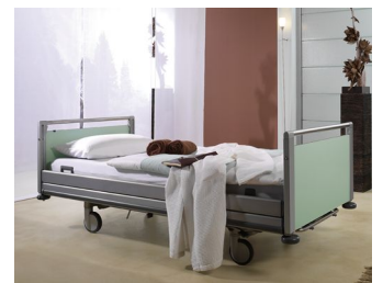
Krankenhausbett Seta, Pflegebett Elvido, Krankenhausbett Seta