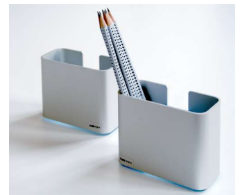
Zettelbox und Stifteköcher Note box and pen holder

Konzeptentwicklung, Produktdesign, Modell- und Prototypenbau, Visualisierung, Basiskonstruktion, Begleitung bis zur Serienreife